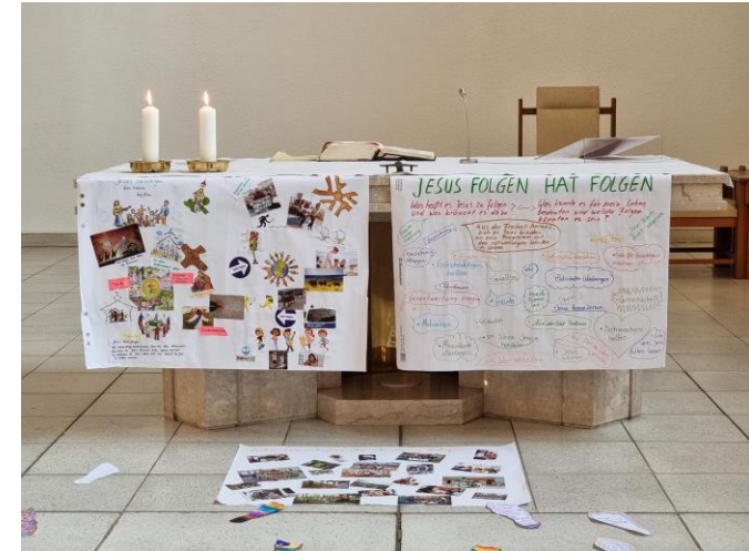
Ergebnisse des RKT im September 2021