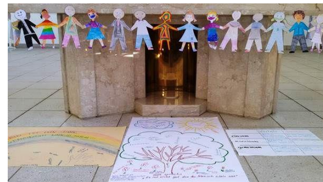
Ergebnisse des RKT im September 2020