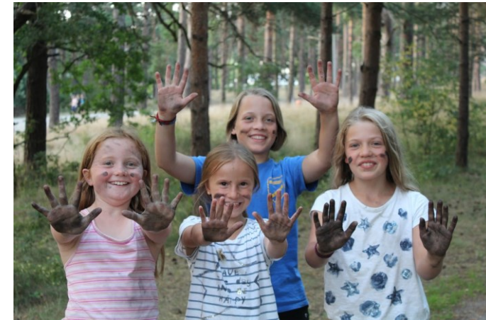
Sommerfahrt 2015