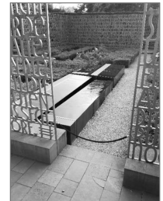
Christlicher Garten

Wie in den vergangenen Jahren verantworten die Arbeitsgemeinschaft Christlicher Kirchen in Marzahn-Hellersdorf und der Ökumenische Rat Berlin-Brandenburg gemeinsam das Geschehen am Christlichen Garten. Seien Sie herzlich eingeladen.