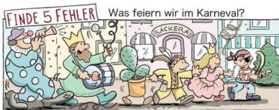
Apfel, Kaktus, Banane, BäckerAl, Weihnachtsbaum

Karneval und Fastenzeit gehören also ganz eng zusammen, doch viele wissen das heute leider nicht mehr. Sie feiern Karneval, doch an die Fastenzeit denken sie nicht. Das ist eigentlich schade.