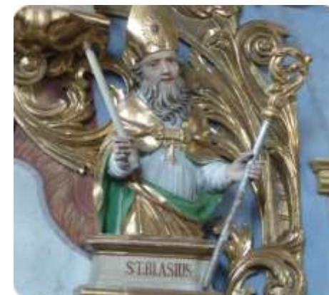
Pfarrkirche Niederolang

„Die Zeit, Gott zu suchen, ist das Leben“, hat der heilige Franz von Sales (1567–1622) einmal gesagt. Am 24. Januar ist sein Gedenktag. Zeit seines Lebens war Franz ein Gottsucher. Der heilige Franz wird auch als Patron der Journalisten und Schriftsteller verehrt.